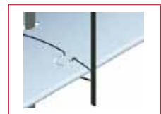
Afb. omgevormig stansgat

Afm. 60 x 18,6 mm of 80 x 18,6 mm, met poedercoating. Aan de zijkanten afgesloten met kunststofkappen. Onderrail kantelt niet.